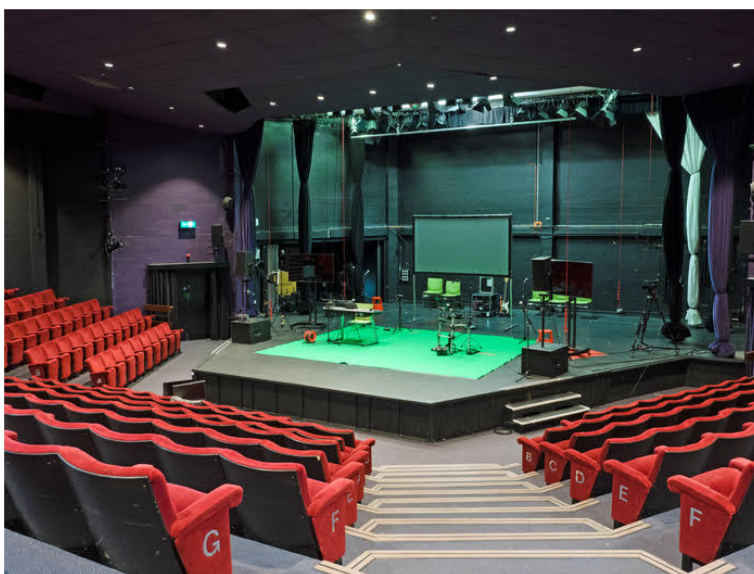
Professionel sceneeksempel, "Thrust stage" type - Gulbenkian scene, Univ. of Kent. Publikum er "med"!