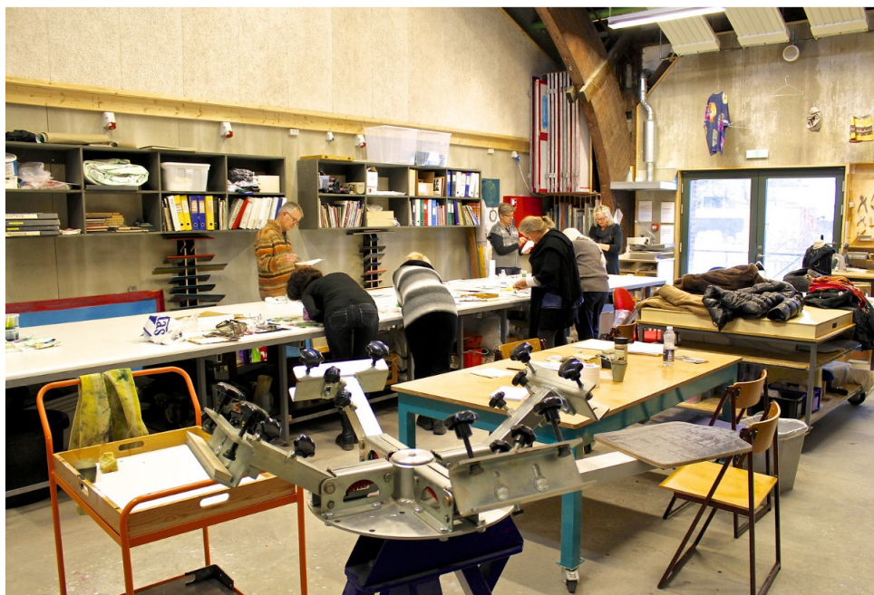
Åbent værksted på Godsbanen i Aarhus

Mange kulturhuse i Danmark tilbyder faciliteter, der gør det muligt for professionelle billedkunstnere mv. at møde entusiaster inden for den pågældende kunstart – maleri, grafik, fotografi, skulptur mv.